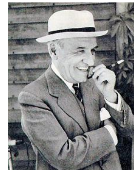
José Ortega y Gasset (1883 – 1955)