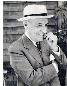
José Ortega y Gasset (1883 – 1955)

El orden es: útiles, vitales, intelectuales y religiosos.